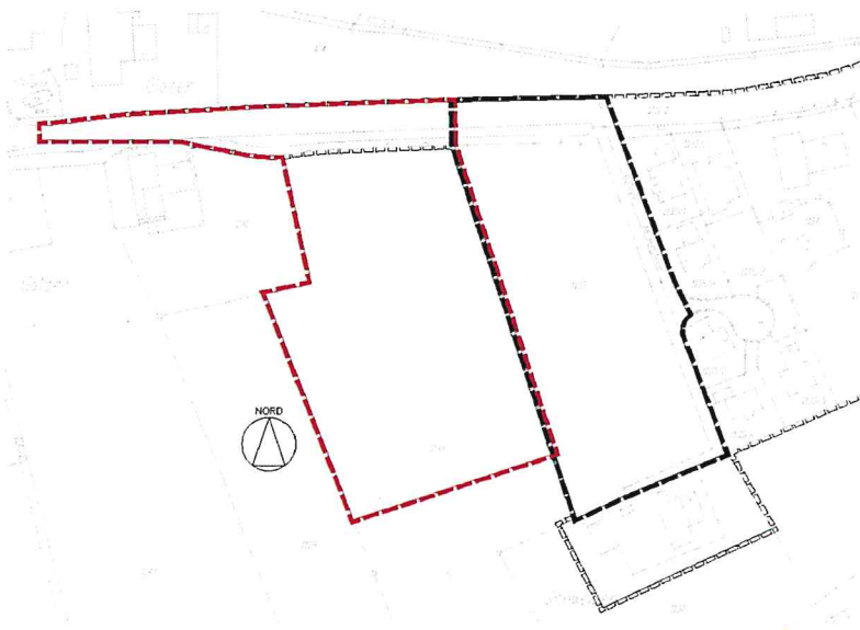
Abbildung 1: Lageplanzeichnung mit Darstellung der Geltungsbereiche, unmaßstäblich, rot: Aufhebungsbereich, schwarz: Bebauungsplan Ebersbach West – 2. Änderung.

Nach der Teilaufhebung erhält der Bebauungsplan die Bezeichnung „ Ebersbach West – 2. Änderung und Teilaufhebung “ mit einer Größe von 0,91 ha.